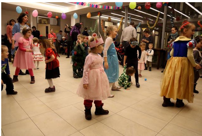
Egy kép a gyerek farsangról

Nagy izgalommal készültünk az idei plébániai felnőtt farsangra, hiszen a „kalapos-meghívó” sok jóval kecsagetetett. Én rögtön ki is találtam, hogy akkor ebből csináljunk versenyt, amivel a rendezőket is megleptem.